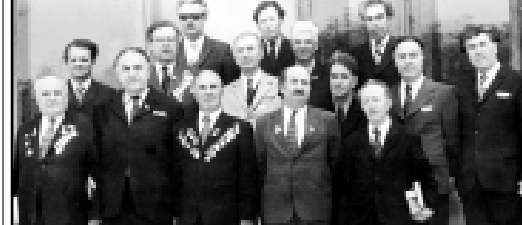
Кулиев Къайсын КЪБР-м и Тхаклужэм я сьезым эхтэм я гысуэ. Фотелъ сурт. 1974 г.г.