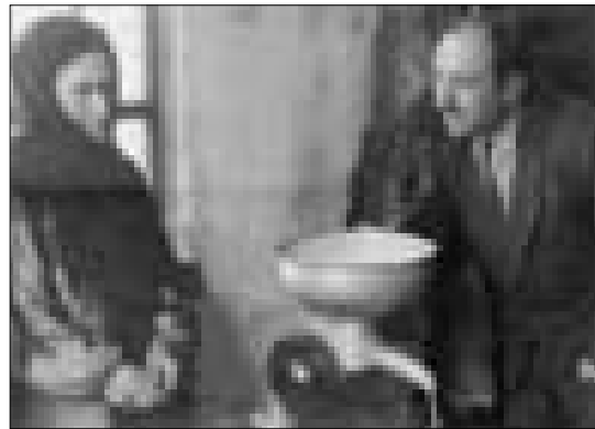
Экспедиция в Безенги, 1959 г. Кайсын Кулиев помогает сепарировать молоко