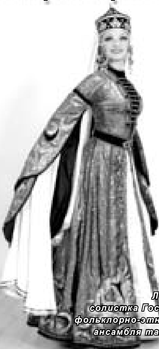
Лейля Гуртуева, солистка Государственного фольклорно-этнографического ансамбля танца "Балкария"