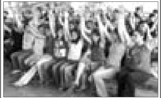
Веселые будни “Баксана”