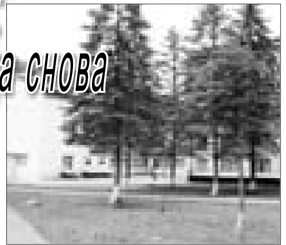
Пансионат «Голубые озера»

с мячом, не обучены волейболу и пионерболу. Благо, что науки эти легко постижимы, и не подающиеся обучению пока не выявлены.