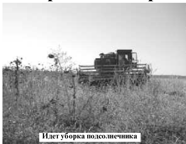
Идет уборка подсолнечника