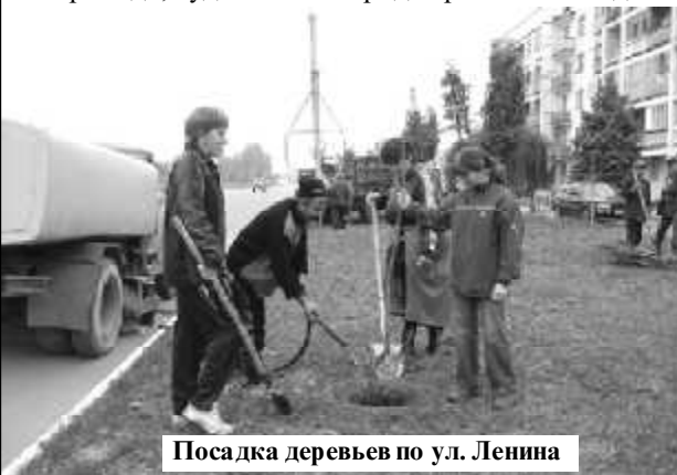
Посадка деревьев по ул. Ленина