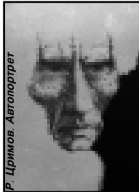
Р. Цримов. Автопортрет

17 октября в Национальном музее республики состоялась персональная выставка народного художника КБР Руслана Цримова, приуроченная к его 55-летию.