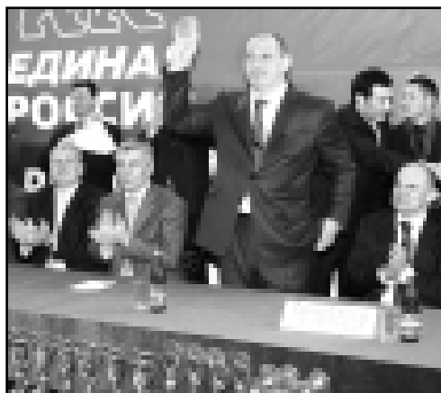
окрытия, который пройдет 21 декабря в Тырнauanе

Победители и призеры турнира получили право выступить на чемпионате Южного федерального