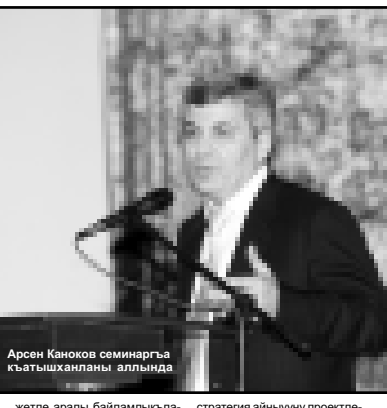
Арсен Канокое семинардагы кытышканы алында