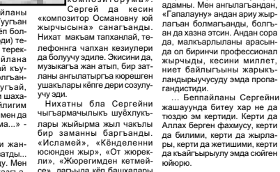
РФ-чи искусстволарынын сыйлы кулдукчуу.