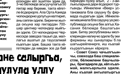
Малкыярлыла тууган журтларына кайткандан сора уу?