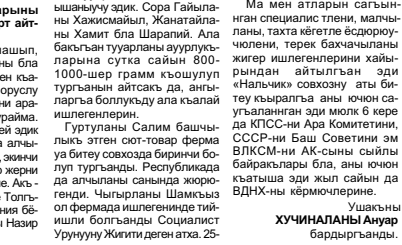
Малкыярлыла тууган журтларына кайткандан сора уу?