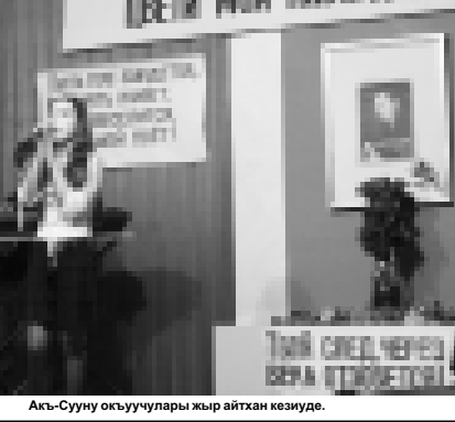
Акс-Сууну окуучулары жыр айткан кезинде.