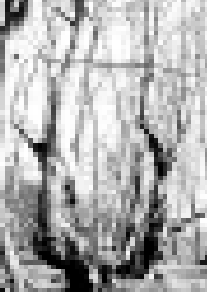
Кюн жылынуу саклайдыла.

Бу кюнде Черек районда спортдан торлюо торлюо эришуле болганды. Огары Жемталада дзюдолдан турнир бардырылганды.