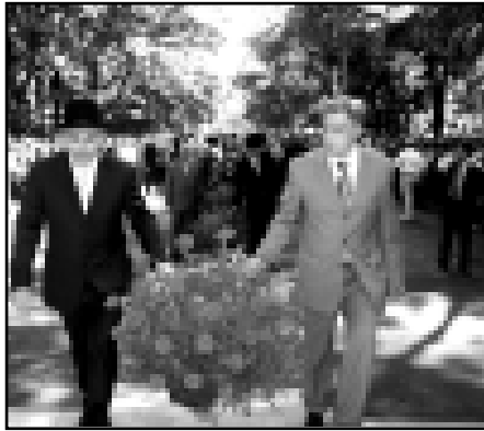
реклерины кызыгыган адамла кѣпге деридей майдандан кетмей тургандыла.

Бюлон былайда бушуулу митинг бардырылмайды, бир ишда асвемей-