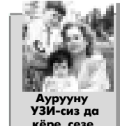
Урууну УЗЕ-сиз да кьри, сезе билген врач