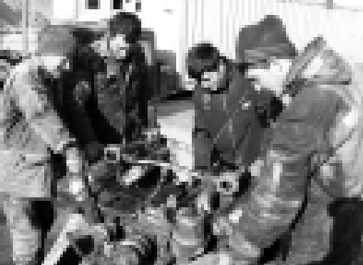
Къурулушда кьыйын кезюуде арда кьалгьнаны ушайдыла. Анга жашу журтла, жолла эм башха кеп торло объектьлени ишлеуге эс бурулгьнаны шакьтанды. Ол себептен къурулуш керекле чыгаргьнаны предпритияла жангырылгьнаны бютюна къууанчырады.