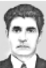
Лирикасы ады. Жокчу онундады десек да, жарар. Аны уланды сөзю Ата журтга, аны ала кесини, сюймеклиге, шүөх-лукчу беклигине, урунуу аруулугуна аталады. Анда кырабу жокду.