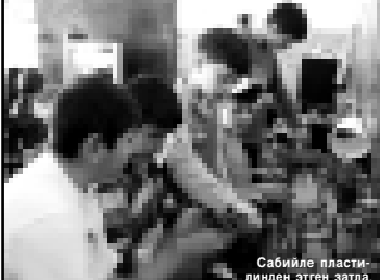
Сабийле пластинден этген залга.

Энди кыалган эки ырыкны ичинде солу юйле санитар-эпидемиология болуучу юсюндөн кыагытлагы кыл селдерге керекди. Бюгонлюкде битену саямаланы этгенге быладыла: УМЦ «Элбрус», «Иткюло», турбаза