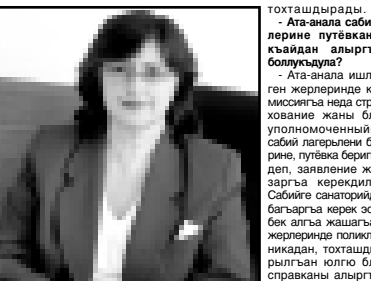
Токташдырады. Ата-анала сабиайерине пугтевалканы кыайдан алгырга болуулау?