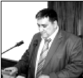
Khuchmenyan Тажир доклад этеди.

КъМР-ни Парламентини Экономика политика жаны бла комитетини кезиуде жыйынуу болганды. Анда сөз къурулуш материалла оюмушенносту айнаытуда болууну эм «Россияни граждандарынуу эм тынгыла жашуу журтла» деген миллет проектин толтурууну жалчытуу жаны бла мадараланы юсюнеринде барганды.