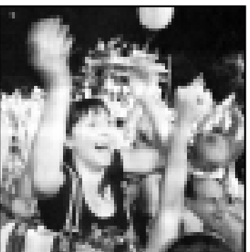
Сочида жашагъанла Гагемаладан жагъилыкъыга улуу къууан бла тобогенди.

РФ-ни Президенти Владимир Путин Олимпиада оюнга къатышыркъланы Сочиде «кери къыш» сакълайды дегенден сора да, оюнланы бийик даражада бардырыр ючюн, къыралны жаньдан 12 миллиард доллар берилгени айтханды эм МОК-ну президенти Жак Рогге берген къалам бла олимпиада указлагъа къол сала башлаганды.