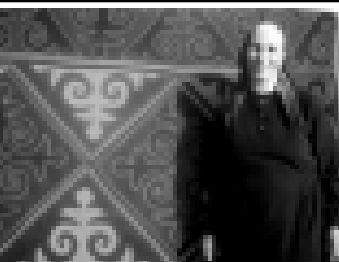
Герман урушда илген солдасты. Мен да айтайм сѣзлерим. Биз урушда кетип барарбыз, Сиз сау кыалгыгъа.