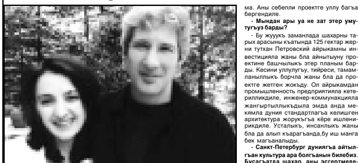
Лариса Ричард Гир бла.

Гостиний Двор деп сатыу-алуу ара барды да, анда сатыучудан башлап, «Березка» сатыу алуу фирманы валюта тюрлендеринде капиталгист кыралланы консулстволарыны жумушларын жалчыуу жаны бла араны директоруна дери торк кѣткюзген эдим.