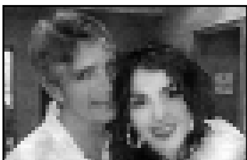
«Фабричакы кыз» айтхылык аруу тиширнуу Джулия Робертси кырандышыны жорегин билгенди.