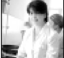
Глашланы Хауа этген кышкылы сабийле бек жаратханды.

Бусагъатда уа жюз окуучу со-луйдула. Лагерде юйретичулло, аш хазырлачула, мек-стерра да бу сабий-легек бек сакыла. Алыны солуларга тынгыла болуу ючюн, кыла-рында келгени аймайдыла.