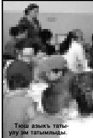
Тюш азыгы татылу эм таптылды.