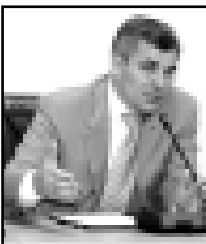
«Республикада уллу торленуле бардыла, жолла, мекимла быйыл кеп Россияни бир жеринде да ишлемейдиле, Къабарты-Малкъардача тапландыруу ишле быйыл кеп бир жерде да бардырылмайдыла. Топу болгъан эм жаны ичинде биз алгъа иги кесек атлам эттенби-электронизирганы, газы кезиу-кези тохтауу, иш хаккы тейлемеу не зат болгъанларын унутханбыс... Кертиди, республиканы башчыларыны ишлеринде жангъалча бардыла, алай алыны тозетирге болгъуду, жалаанда бир зат этмеген жангъылмайды. Битеу бу жетишимге жетер ючюн, къалай уллу къыйын салынгандын аныларга бийликтеге да бардыла», - дегенди жер бла байламлы халла жаны бла комиссияны башчысы Черкесланы Георгий КъМР-ни Президентинде Жамауат-консулгатины советни Кордонгъа комиссияны жыйынууда. Президентге айланп. Ол «бары тохтаган миллетчилик кезиу-кези»

му» властыны ишине чырмау этерге жорюшгенлерин, Минги тауну тиресине инвестицияла келсе, анга не къаады иги болгъан ала анылап-апыларын чертгенди.