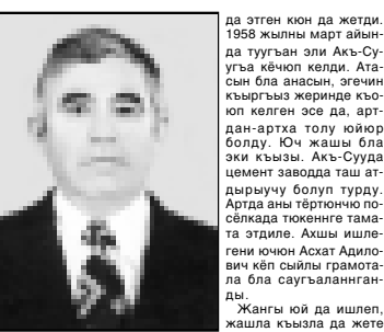
колхоз сабанлагы да суу салгына кеп эдиле ол кезинде.