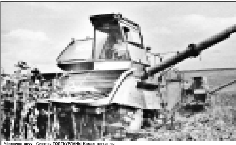
Чёлеуно оруу.

Къабарты-Малкъар Республиканы Президенти А.КАНОКОВ.