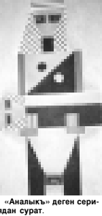
«Аналык» деген серидагн сурат.

ХОЛАПАНЫ Марзият. Суратланы автор алганды.