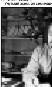
Унутмай эсем, ол семинар сорду бир жол Кыйсын.

Кылапай улуу насип зди манга дунягга аты айтылган Кыйсын бля сюелип, ушак эттегини. Ол назмуларыма махтаганда уу, дуняда менина ким болсун! -