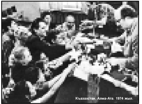
Кыазахстан. Алма-Ата. 1974 жыл.