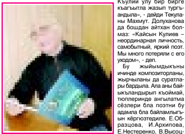
Къайсынны назмулары музикага кыйын салынады деген оюм жорюдо. Поэзия наму тизгилери музикага тынч келише да болмаза. Алай искусствону келечиси, керти фахмулу эсе, жараткан чыгармасына келишин форманы табылгыды сахнада, музикада да.

Иги китап адам улуну биргесине жашап, онга жол нѳерлик эткенде келеди. Бюгюндѳ о улуну поэзия, композиторун жырлары жыйылган жыйымдык эсе ую, анда ксуру акъ сѳзю кочюн сезим кыймайбыз, аны бир бирлерин толтура, искусство чыгармоо болоды. Жан блоу бир бирге болсагырмаса эке бир да тап келгешон сѳз болгон умек бѳл кичи кибик деп. Эсимий Къайсын а бир назмусында «суу бѳл улай» дегенди.