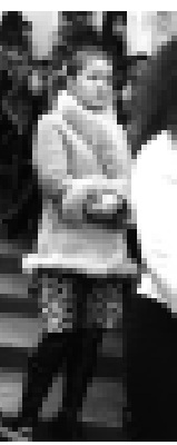
Студенте соруула берилде.

Европада да жоктулда аллай онгла, бизде уа битеу шоклада компьютерле бардыла. 2010 жылга эл молк продукцияны 70 процентини кесибиз чыгарыкбыз. Иш хакыны 25 минг сомга жетдирге деген борч салынганды. Көп жолу, шарлар,