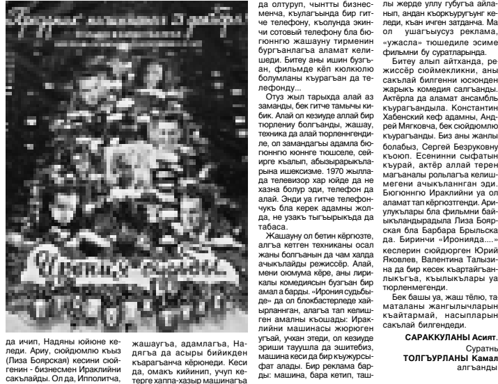
жашауга, адырлагыга, Надеяга да асыры берилген кыргызанча кѳрѳнѳди. Кеси да, омак кѳйинип, учуп кетерге хаппа-хазыр машинага