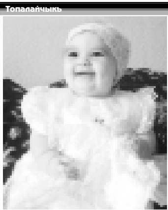
Убашланы Асиятка он ай болады, ол Нальчикте жашайды.