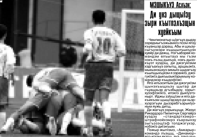
Спартак-Налшыкым и гуфгэуэц. Ар ЦСК А-м текүүл!