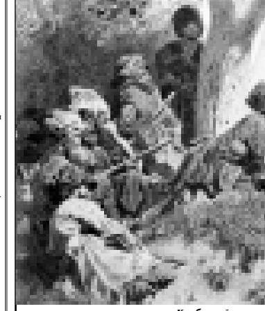
Кубэрдэй полым этэ шакуу гуп.