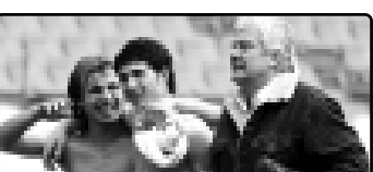
Зы тэлэи и пэ Кьэжэр Назир (и кум дэшт) топ дигэжлэш.