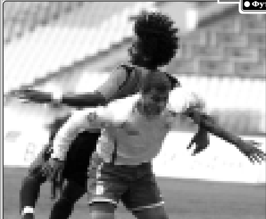
Жорэ Шумейкэра тхэйлжэ зонькуужуу.