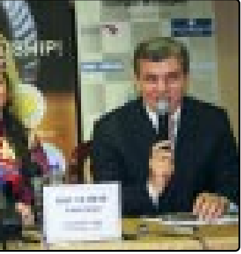
Фиде-м «Итху» егызуэ

АПУЭДИЗ зэманыш шыкматыр ин пылапш шыта ди шыхуэру дунейска мыхэнэ эмбI апуэди зэхэкъэхуэр зэрэлажэ ахумэтистикэ шаруэлэхэм нэбэгъжэ зыхуэшышым 16мал зэрэлаж кыдыкхуэр, хашыпшэу нэхэ дикъжэацI а пасэрей джэгуэлI тельдикэм.