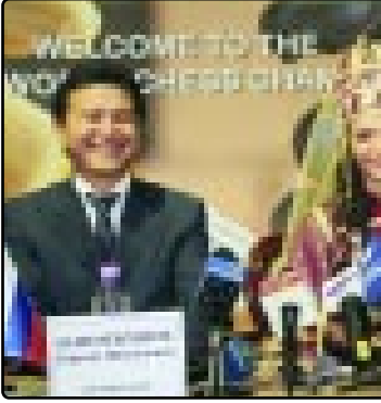
Араты инахъ тхэмэхумэм нэбэгъжэ дI республикэ шэфуэля ШахматчыкI Шыкъхэжэ а дунейска чемпионатар

Къабрдей-Балкър Республикэм и Президент КЪАНОКЪУЭ Арсен Налшык калэд 2008 гъм фокладэм и 17-м №91-Г/М