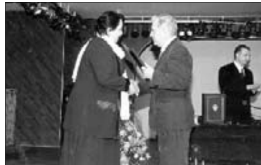
На вручении диплома в Москве

ответила: «Книга (не люблю этого слова, но по-другому не скажешь) – товар особый, специфический, уникальный. Поэтому к продавцу книг тоже должны предъявляться особые, высокие требования. Специализированных учебных заведений, готовящих кадры для работы в нашей сфере, нет, вот и приходится брать эту обязанность на себя руководству каждого книжного магазина. Мне самой это не в тягость: честно говоря, предпочитаю с нуля обучить человека, чем переучивать его. Я лично участвую на всех этапах подбора кадров: от приема документов и собеседования до анализа работы соискателя