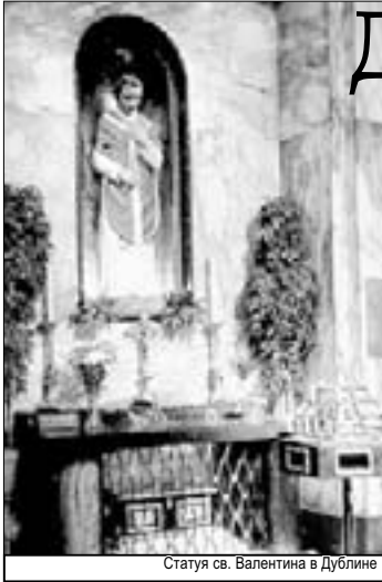
Статуя св. Валентина в Дублине

Праздник любви не имеет глубокой религиозной основы. Однако история его необычайно романтична.