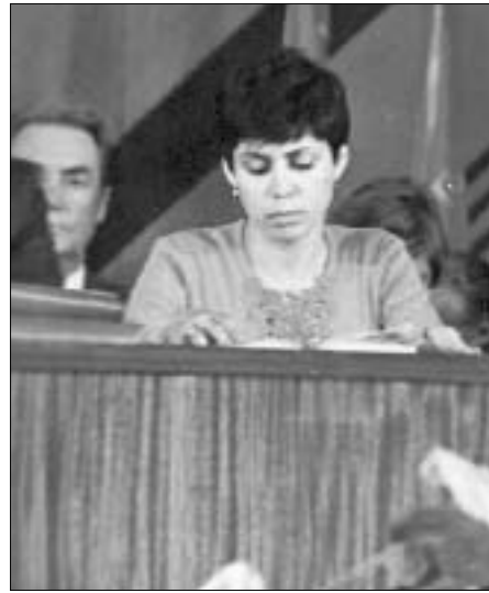
Нальчик, 1978 г.

батывает: скорее, спорт воспитывает в человеке определенные качества. Мы не совсем правильно смотрим на спорт. А спорт – это прежде всего организация свободного времени, это здоровье, это умение идти к результату, умение вести себя в амбициозном коллективе. Любимый человек, который занимался хотя бы немножко спортом, как пра-