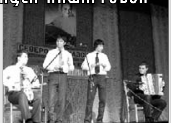
Музыкальная группа ансамбля "Хатти"