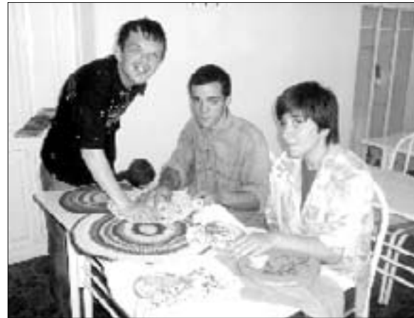
Воспитанники со своим поделками