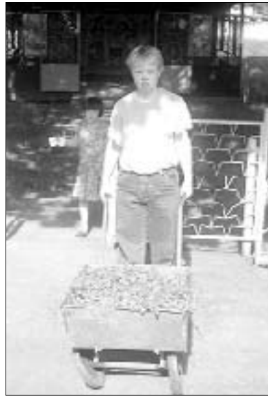
Дети сами убирают территорию