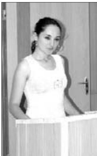
Студентка лицея уверена в своих знаниях