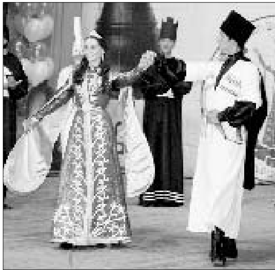
Шахматная королева танцует "Кафу"

Пожоже, за время чемпионата не только главный арбитр, но и кое-кто из участниц заинтересовались языками коренных народов КБР. Чемпионка мира Александра Костенюк, появившись на сцене в костюме кабардинской княжны, начала свою речь с приветствия на кабардинском и балкарском языках: «Фи махузу фыузу! Кюн ахшы болсун», а затем, перейдя на русский, сказала: «Я от всей души хочу сказать спасибо болельщикам, зрителям и организаторам чемпионата. Спасибо всем, кто меня поддерживал на протяжении всего турнира. Надеюсь в будущем еще порадовать своими победами». После этих слов чемпионки к собравшимся в зале обратился Президент КБР: «Немного грустно, что чемпионат завершился и наши гости, съехавшиеся в Нальчик со всего мира, покидают Кабардино-Балкарию, - сказал Арсен Канокв. - Я надеюсь, что у них останется добрая память о республике и ее жителях. Для нас же чемпионат мира будет золотыми буквами вписан в исто-