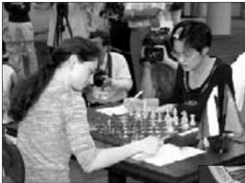
Российско-китайское противостояние за шахматной доской...

Честно говоря, не все журналисты сразу проявили энтузиазм к участию в блиц-турнире. Но зато потом