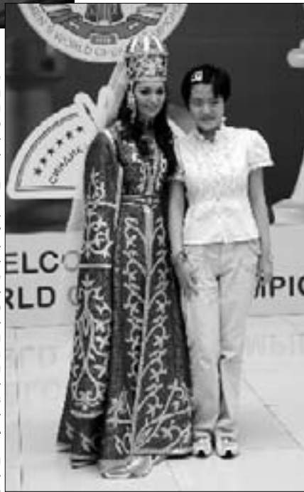
...завершилось дружеской фотосессией

Как и положено, в финале встретились две самые достойные и, по всеобщему признанию, сильные участницы чемпионата. Противостояние между представительницами двух великих шахматных держав было интересно не только само по себе, но и харизматичными личностями самих участниц: Александры КОСТЕНЮК и Хоу ЮИФАНЬ.