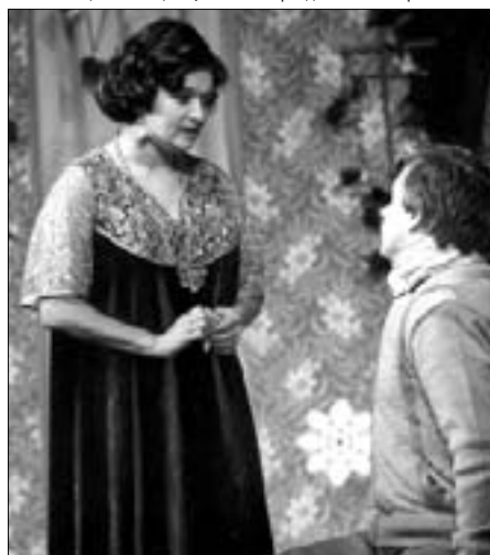
Сцена из спектакля «Семейный доктор»

- Прошлый театральный сезон мы закрыли этим спектаклем. Один мужчина после спектакля сказал мне: «Я плакал весь спектакль – вспоминал свою мать. Я мог ей дать больше любви – теперь уже поздно...» После недавнего показа опять приходили люди и рассказывали о своих мамах со слезами на глазах. Я рада такой реакции. Многие актрисы, переиграв ярких молодых героинь, а потом светских дам балзаковского возраста, очень болезненно переходят к пожилым героиням. А я считаю – всему свое время. В осени жизни есть свое обаяние. Для этой роли я пригласила