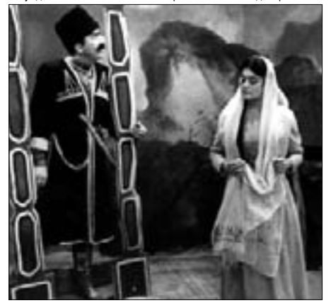
Сцена из спектакля «Адиохо»

Отношение к артистам... оно должно измениться. Сейчас артисты с регалиями получают пять тысяч, а начинающие – две-три тысячи. Это, конечно, ненормально. Ведь актер – всегда загадка. Согланнись, если у загадки стоптаннись туфли, ореоп тайны тут же исчезает. В Кишиневе мы одевались на импортной базе. У меня были американский плащ, французские туфли. Так должно быть, ведь на нас смотрят люди, нас обсуждают.