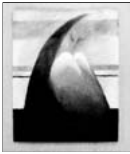
"Сон", Л. Тхакумачева

По словам искусствоведов, выставка стала огромным событием в жизни не только Северной Осетии, но и всего Северного Кавказа, внесла огромный вклад в развитие культуры всего региона. Было создано удивительное пространство, в котором каждая художница смогла занять свою нишу, не нарушая общей гармонии. Все работы отмечены чувством вкуса, меры и профессионализма. Есть понимание того, что именно женщина является носителем гуманистических ценностей, является оплотом мира, именно она дарит жизнь.