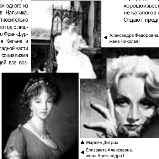
▲ Александра Федоровна, жена Николая I

Если все же немка купит косметику, то французскую или итальянскую, хотя, бывает, отдает предпочтение и отечественной. Индустрия красоты в стране, несмотря на то, что по уходу за тем же волосами немки идут в парикмахерскую только, чтобы сделать стрижку, достаточно развита. Есть сети салонов, специально предназначенные для студентов и молодежи, под доступным ценам, например, 10 евро за причёску и ответственное обслуживание сохой шкалой цен за различные услуги. Правда, услуги салонов, парикмахерских, спа, бань, массажных кабинетов больше пользуются почему-то мужчины. Вот уж кто не жалует стилиzer в жизни, индустрия красоты в Германии все же можно. Но не в повседневной жизни, а по торжественным поводам – выпускной в школе у детей, первый бал дочери, свадьба в ресторане и прочие мероприятия подобного рода».