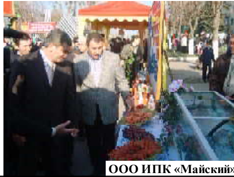
ООО ИПК «Майский»