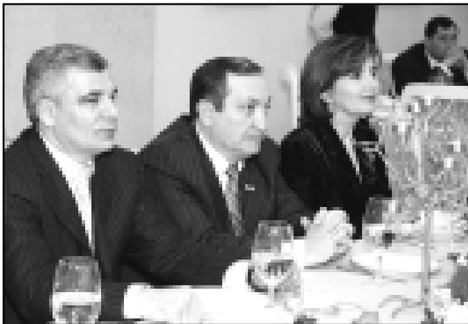
29 января в Доме правительства прошло торжественное открытие Года семьи в Кабардино-Балкарии.

На торжественное мероприятие были приглашены представители 49 семейных династий, многодетных и молодых семей из всех районов республики, для которых в Колонном зале Дома правительства были накрыты праздничные столы. Всего же в республике насчитывается 2440 семей, в которых воспитывается пять и более детей, один из которых является несовершеннолетним.