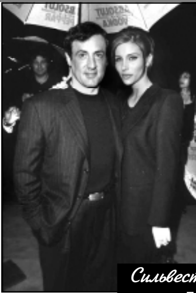
Сильвестр Сталлоне Для Ляны; для Эммы

В последние годы Сталлоне не только снимается, но и выступает в качестве сценариста, режиссера, писателя. У него прекрасная коллекция живописи, по отзывам знакомых, ныне Сталлоне – обаятельный и остроумный собесед-