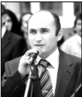
Всех присутствующих на торжественной линейке растрогали первоклашки, в стихах рассказавшие, как волновались перед своим первым школьным днем, и пообещавшие «когда-нибудь стать знаменитыми».

Торжественный праздничный концерт в этот день не затянусь – для учителей, школьников и их родителей были исполнены стихи, песня и национальный танец. После этого первоклашки разошлись по классам на первый в своей жизни урок – урок Мира.