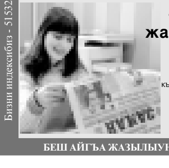
Бизни индексолиз — 51532