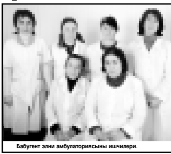
Баугент элини амбулаториясыны ишчилери.

аш этип, келген кыонакылага сатканда да бардыла. Тиштурула эштен жок заттарын алайга этип сатадыла. Чен дайладан башлап жамычкыла, башлыкыла жери анда кён иги затла алырга болушуду. Топло-топто болушу жок келгенде, сабий жыйыркыкыладан кеюонго алмай турчуды. Энде мал тутхан койурле кедрине. Ала эл тиерсиде жерлини ортакчы алгандайла. Жайыкылада туураларны, койларын коттедиле, бицениклерини чададыла. Блекладан кредитле алып, малкол кыурагына да бардыла.