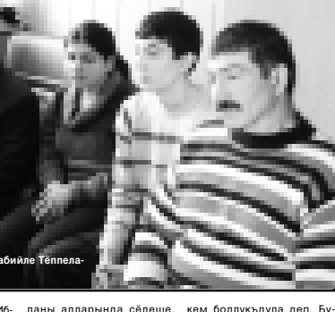
Конкурсда хорлаган сабийле Тёппеланы Алим бля.

Зайнаф сааддан Атаккуланы Ибрагимге, Огуры Малсарыны биринчи номерли школундан Мисирланы Фатиматха да башлаганыбыз, анди мындан ары аны бютон иги этерге дейдиз. Шёндө, хар гиче миллет адеттерин, төрелени, энчиликтерин, тукум даражаларын тас этерге кырууу тошген кезюмде, ана тишин сабийлеге билдирге керошюно магданычы болмаганды уллуду. Бир кыауула алап саудыла: орус тишин билмеселе, жашаудан бир жанында кыаллыкында, кёл затдан