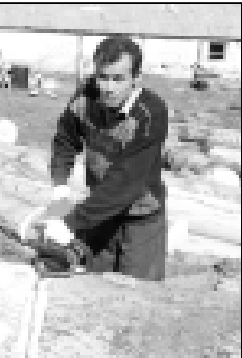
«Элбрус агъач моллак» халкъта керекли кеп зат чыгарыла. Къулчалы Шараний мында этргден бек иштейди. Кесилген агъачны хетге ёлдорюден алгъа хазырлагъа да оуду.

КъМР-ни Президентини бла Правительствоуна пресс-службасы.