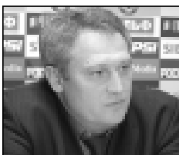
Коне контракт бла ойнаркыдыла.