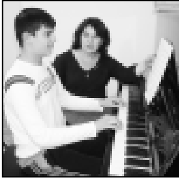
Кызыккыла бла жаш...