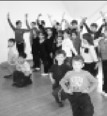
Школ ачылганыла окуу...

ХозАЛАНЫ Маризат. СУРАТЛАДА: (башында) Хозаланы Маризат Кичмонданы Таубийни фортельноу согарга юйретеди.