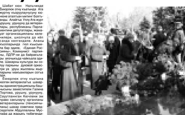
аскер аянтларына кертчилеклери ёсоп келген төпөлөгө юлгудю. Россияны тынчылыкты жашаууну кыруулууга хар тейю да кыялын салганын айтып, ол миллионла бля жашларыны урушда этген кишиликтери уа ёмюрлукте. Алыны тууган журтта сыймакликтери, жигитликтери, аскер аянтларына кертчилеклери ёсоп келген төпөлөгө юлгудю. Россияны тынчылыкты жашаууну кыруулууга хар тейю да кыялын салганын айтып, ол миллионла бля жашларыны урушда этген кишиликтери уа ёмюрлукте. Алыны тууган журтта сыймакликтери, жигитликтери,

Ахырында гимн согулгубу. Ол бошалгандан сора уа Ёмюрлук отну кыатында эсертеме гюлле салгандыла. ХОПАЛАНЫ Марзият. СУРАТДА: Ёмюрлук отну кыатында эсертеме гюлле салыу.