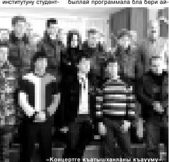
«Концертте кыатышканы кыауу»