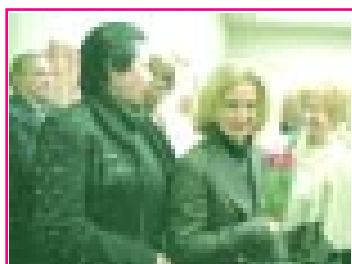
5-чи мартда КъМР-ни Музилет музейинде «Горюк» газетин 15-жыллыгына ала Тиширыулары халкъа аралы конюне - 8 Мартха - аталган кермюч ачыгъанды. Анга республикада ишлеген суртчы тиширыула къатышхандыла.

Культура, спорт эм туризм жангы бла комитетини председатели Заур Ашнее, КъМР-ни Парламентини депутаты