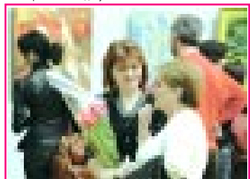
Кермючге КъМР-ни Правительствосуну Председатели заместители Медина Дышкова, КъМР-ни культура эм информация коммуникация министриси Заур Туттов, КъМР-ни Парламентини Председатели заместители Людмила Федченко, КъМР-ни Президенти советниги Уналаны Аминат, КъМР-ни Парламентини