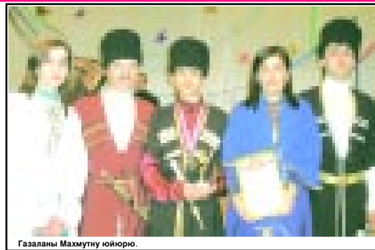
Газаланы Махмутну юйюрю.

конкурсда хорлагъанлары алгъышлагъандыла, мындан ары да тутучу, бир бирини аылгъагъан юйюрле ботон бил болупларын суйгенлери билдиргендиле. Ахшы, толун юйюрледе ёсегиле хар не жангы бла да тири, билимли, ангылауу, саулукулду да болгъанларын чертгендиле. Андан сора конкурс башланганды. Анга къатышхан ата-анала, хар юйюрден бир-бирер сабий да, кеслериини жыр, нэму айтыуда, тепсеюуде, сахна оюн кергозюуде, аш-суу этиуде эришип, усталыкъларын кергозюуде, «Юйюрни насыбы недеди?», «Атала уа юй бийчелени къылыкларында нени жаратдыла?» - деген, дагыда башха соруулагъа жууал бер-