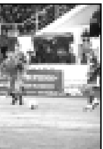
«Кыраачай» газетден алынганды.

Матчы башында окуяну он асыры акырын бара эди. Нолычине, кеси майдандында болганында, оюнна келишпай кой көсок тургандыла. Алай топ алгачы тошкенди а динамомучуны кыбакка эшиктерине жууккылаша башадыла.