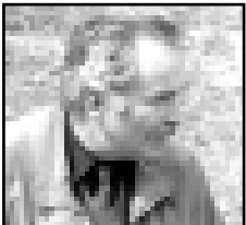
да кыраачай. Эки кызылары, туудуктары да барды.