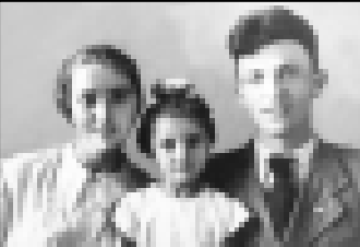
Укутулыны Ханафий кой бийчеси эм кызы бля. Фрунзе шахар. 1946 жыл.