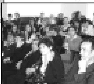
Жаппуланы Тамира өслөшөди.