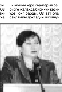
Жаппуланы Тамира өслөшөди.

тацилауу төрели формасына өтеди. Аны сөбөлү 2008 жылда бир кыргыз элекмени сынуу ишчеге кыаргарга керек тойюндю.