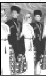
«Алан» ансамбль тепсеуди.