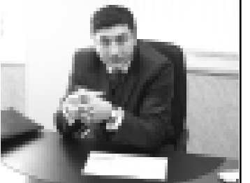
Айтылганлай турды, мен сартын, аны магынасын көлө алгылаимды. Он угтай эсенг, аны хайрылыгыны иги эселей кыюлды. Аны боа байымы былай сооруга союме: «Керими эди ол реформа?»