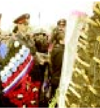
ТАППАСХАНАНЫ Ашинов. Суратны ХОЛАЛАНЫ Маризат алганды.

Биз бу уа атлы аскерчилени эгерметлерине ары келгенге гюлле бла венюкта салгандыла.