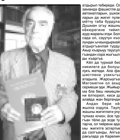
Алгаракылада КМР-ни жакшы посты Махтаны Сафарга жуушу бл барган эдим.