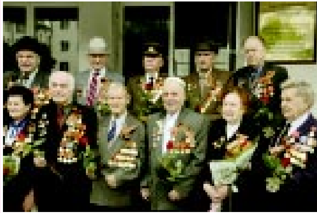
Хорламны солдатлары. Суратны ТОЛГУРЛАНЫ Камам алганды.