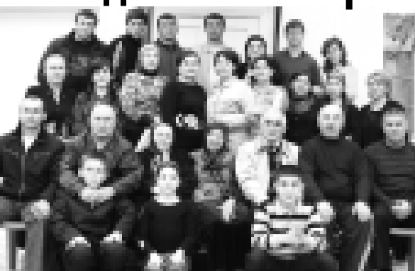
Аныкюлда Жолбаланы Шарайпны бля Райны койорно танымаган хазна адам болмаз.

Бу койорде беш кыя бля юч жаш бардыла. Апыны тамата жашлары Юсуп, Москвада гидрометеорология институтта окуп, анда аспирантура да жетишилди болушканды. Ол КыМР-ни эл мюлк кыярыл академиясында ишленгени 25 жыл болады.