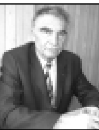
Магомет да, эллиле да сойоп эгерде.

Бир кызуумла, бар амаланы толду хайралып, муратларына жетерге кюрешипди, жетишимле да болдурадыла. Башкыла а у артык бек кыялыгырга соймейди. Ол негда бу жумуш толтуруулмай калса, алай болду эсе, не этериксе деп, тынчайып тохтауудуна. Малкыарлана Махмуту жашы Магомат алайлапдан туююндю.