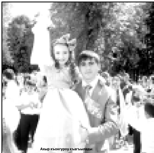
Ахыр къонгуроу къагылады.

тиялары, учреждениялары келечилери тире катышханды. Бизни корреспондентлерибиз да бир талай жерде болгъандыла эм кёрген затларыны оюсун хабарлайдына.