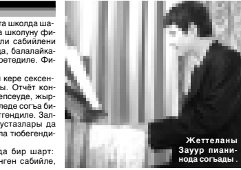
Жеттеланы Зауур пианинода согаргыла.

Белгилеп айтырча дагыда бир шабт: школуну филиалында койренген бир суртал.